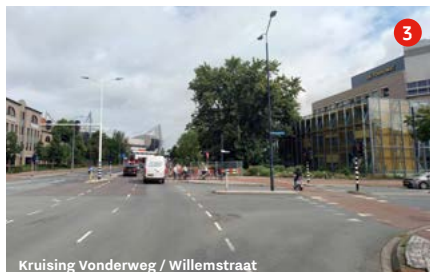
Kruising Vonderweg / Willemstraat