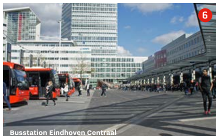
Busstation Eindhoven Centraal